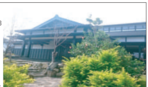
屋久島空港前 縄文の宿 まんてん

【お問合せ・ご予約】 リゾート事業部 新横浜予約センター TEL : 045-471-8311