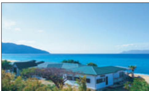
海亀がくる宿 マリンブルー屋久島