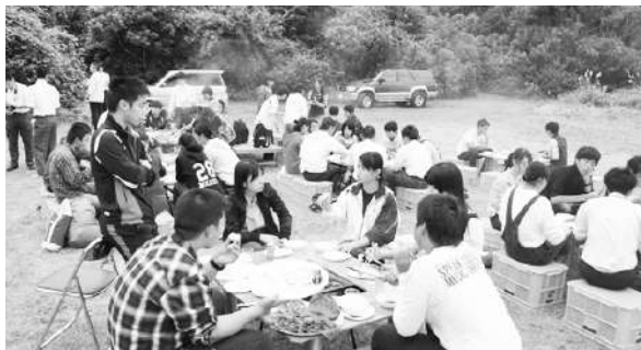
有馬高校とのバーベキューパーティ

屋久島高校から、 屋久島高校の普通科 には、平成十三年から 県内で唯一の環境コース が設置されています。ス 屋久島の豊かな自然に 触れ合い、地域の文化 を学び、多くの研究と 体験を通して、将来の屋 久島、未来の日本や世界 の環境のあり方につい て学んでいます。具体的 には、学校設定科目 である「環境総合」屋久 島環境ゼミナール、 授業の他、宿泊研修、 野外活動、実習、郷土料 理実習、組んでいるとこ ろです。組んで、口永良 組として、口永良部の での学習キャンプと 兵庫県立有馬高校との 交流会が行われていま す。このうち、昨年八 月に二泊三日で行われ た、口永良部島の学習 キャンプでは、ユウモリ 観察やウミガメ調査の 他、里めぐりや歴史学 習を通して、地域の歴史 とも交流することの方