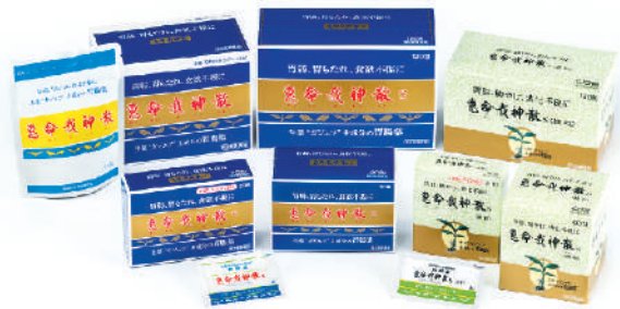
ガジュツの苦味が特徴の散剤(左)と、服用しやすい細粒タイプ(右)

お問い合わせは、下記フリーダイヤルまたはホームページへ。ホームページでは、全国の取扱店をご案内しております。