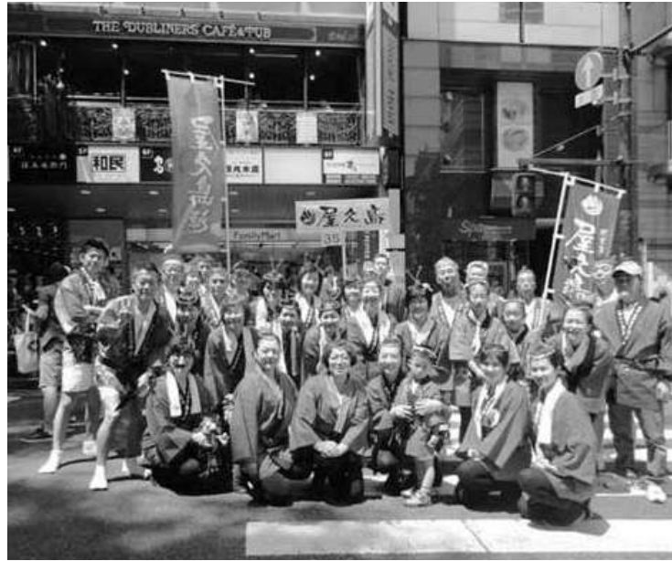
第20回渋谷・鹿児島おはら祭

▽「第20回渋谷・鹿児島おはら祭」参加ご報告 『屋久島連』は5月21日(日)に開催された渋谷・鹿児島おはら祭に昨年に引き続き参加し、世界自然遺産のふるさと屋久島を大いにアピールしました。 祭りには全体で64連、総勢2,500人の踊り手が参加する中、屋久島連は36名、その内子供が5名と3世代型のチームに変わってきています。観光で島を訪れた沿道の見物客から大きな声援もいただき、楽しい交流も持ちました。 来年もより拡大した3世代型チームで参加します。 2018年は5月20日(日)開催決定！ ★初参加の方も熱烈大募集中！